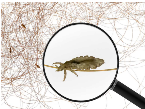
Pidocchio del capo

Il pidocchio del capo è un parassita di piccole dimensioni (2-3mm) di colore grigio-biancastro, che si nutre di sangue pungendo il cuoio capelluto ripetutamente. Si riproduce depositando uova (le lendini) che appaiono come puntini di aspetto biancastro, localizzate soprattutto nella zona della nuca e dietro le orecchie. Possono essere confuse con la forfora, ma a differenza di questa, quando si scuotono i capelli, non volano via e rimangono bene attaccate.